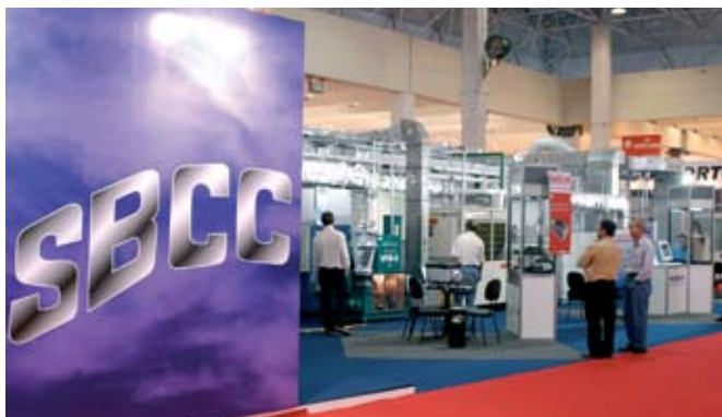
Vista parcial da primeira Ilha Temática SBCC – Áreas Limpas

“O trabalho da SBCC é muito profissional. Graças à participação da comunidade, a SBCC tem hoje os recursos para atuar com grande visibilidade.”