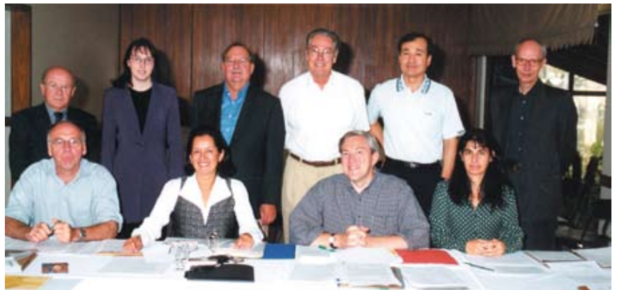
Acima, a reunião dos Delegados Internacionais do ICCCS, organizada durante o II SINICAL. Ao lado, ata da reunião na qual a SBCC foi aceita como membro da ICCCS