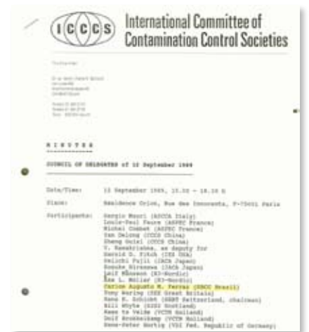
Ata da reunião na qual a SBCC foi aceita como membro da ICCCS

Outras ações importantes foram a filiação à ICCCS – International Confederation of Contamination Control Societies e a assinatura do Contrato de Cooperação Mútua com a ABNT – Asso-