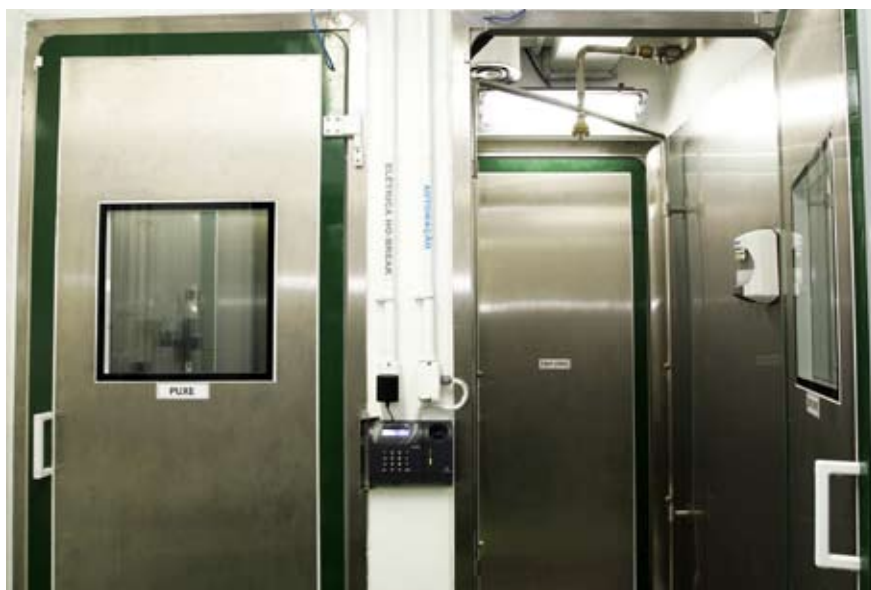
Vestiários de acesso à área biocontida