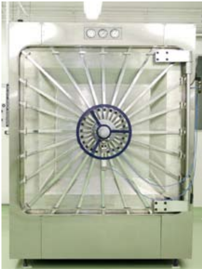
Autoclave tem capacidade de três metros cúbicos

processo biológico. Aprovado, o meio de cultura vai para tanques de cultura de célula, onde são multiplicadas para