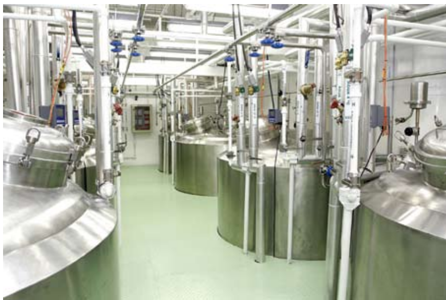
Tanques destinados a formulação da vacina contra aftosa