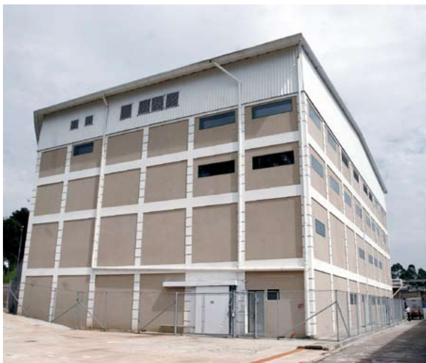
Nova fábrica de vacinas contra a aftosa do Biovet

Na implantação do sistema de efluentes foi aplicada uma solução própria que significou otimização dos recursos naturais. Como a água utilizada só pode ser descartada depois de esterilizada, criou-se o procedimento de encaminhar até tanques especiais que estão dentro da área biocontida, nos quais a água passa por um processo de aquecimento para descontaminação a 100°C por uma hora. Terminado o processo, a água quente vai para a área de tratamento de efluentes externa da unidade industrial, onde os 5 mil litros de água quente vão se misturar à água fria encaminhada por outras operações da unidade em tanques com capacidade para 10 mil litros. Assim, a água quente é resfriada naturalmente possibilitando o descarte com rapidez.