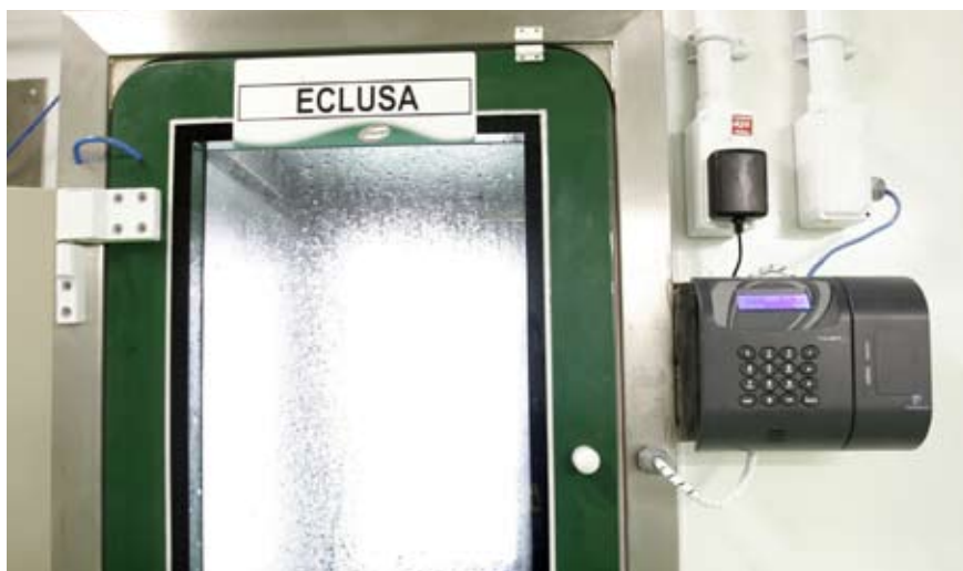
Controles eletrônicos garantem a eficiência da cascata de pressão