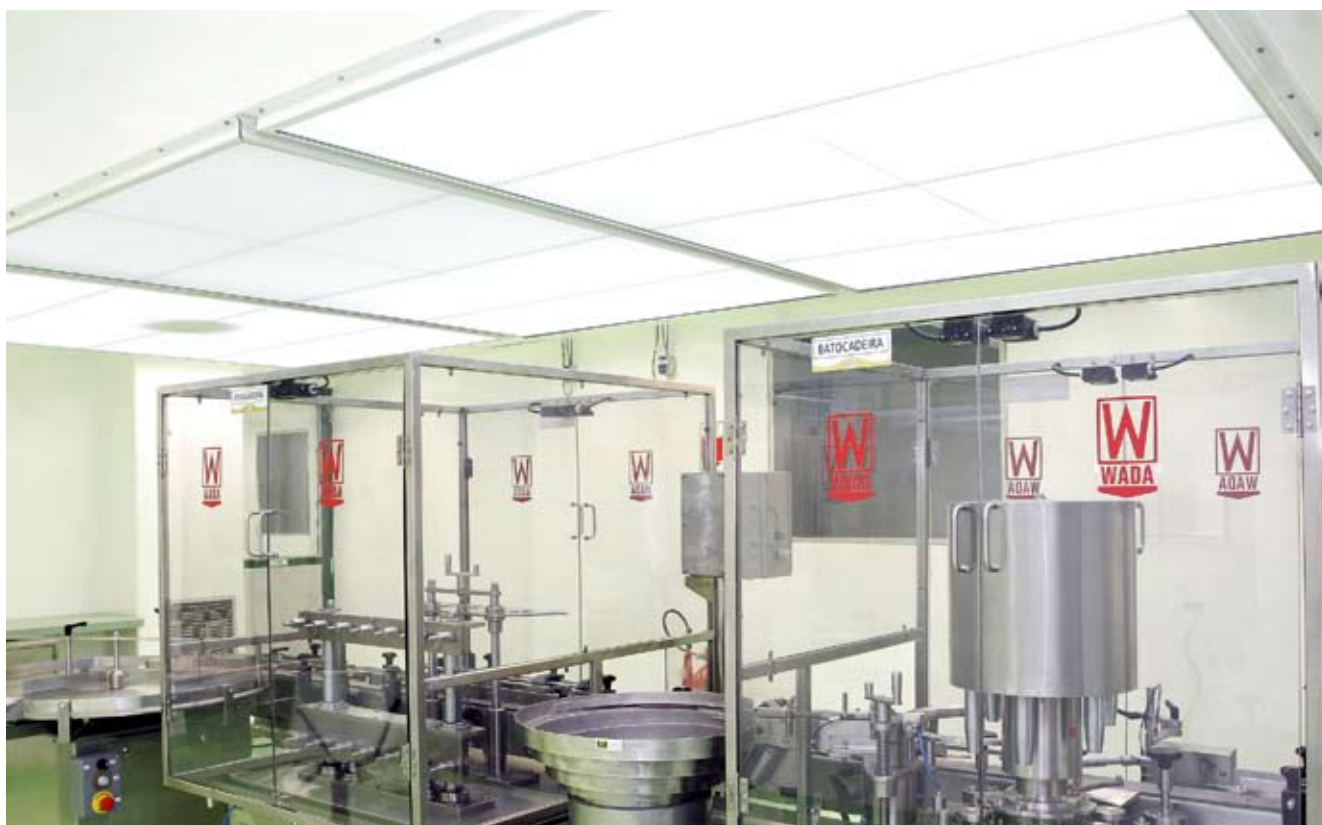
A sala de envase, um dos destaques do empreendimento, incorporou o conceito de fluxo unidirecional de teto, que protege a área ocupada pelo equipamento de envase