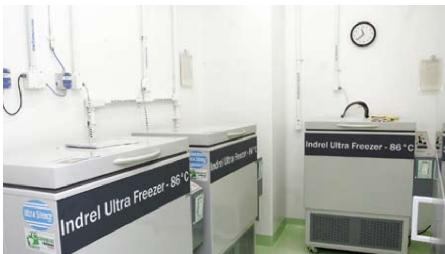
Laboratório onde os vírus ficam armazenados