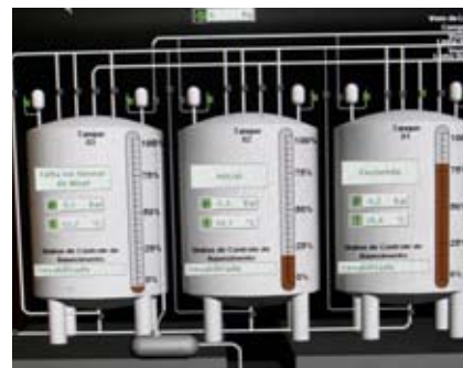
Detalhes de um dos inúmeros painéis de controle

uma série de tanques que viabilizam a formulação da vacina contra a aftosa. Em função do tamanho dos tanques, esse piso tem pé direito de 6 metros, com dois níveis de plataformas que permitem o acesso às partes superior e inferior dos tanques. O primeiro ponto de produção é para desenvolver o meio de cultura. Tanques com capacidade de 8 mil litros recebem um líquido enriquecido com vitaminas e sais minerais, criando um ambiente propício à multiplicação das células BHK.