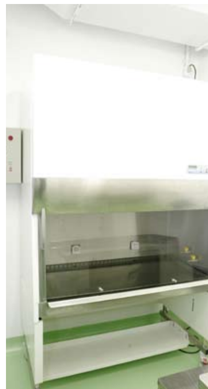
Cabine de alta segurança biológica

na sala de operações. Se, por ventura, uma dessas CPUs falhar, o sistema de supervisão acusa a ocorrência e permite que o operador faça a manutenção independentemente, sem interferência nas demais máquinas, que continuam a operar normalmente.